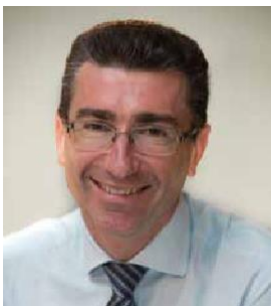
Marc Lemaitre főigazgató, Regionális és Várospolitikai Főigazgatóság, Európai Bizottság

Az energiahatékonyság támogatását célzó, támogatási komponenssel kombinált pénzügyi eszköz (EEFI) modelljének közzététele rendkívül időszerű. Az új geopolitikai valóság megköveteli, hogy drasztikusan felgyorsítsuk a tiszta energiára való átállást, és növeljük épületeink energiahatékonyságát. Az energiahatékonysági felújítások kulcsfontosságúak a REPowerEU kezdeményezés azon célkitűzésének megvalósításához, hogy fokozatosan megszüntessük az importált fosszilis tüzelőanyagoktól való függőségünket.